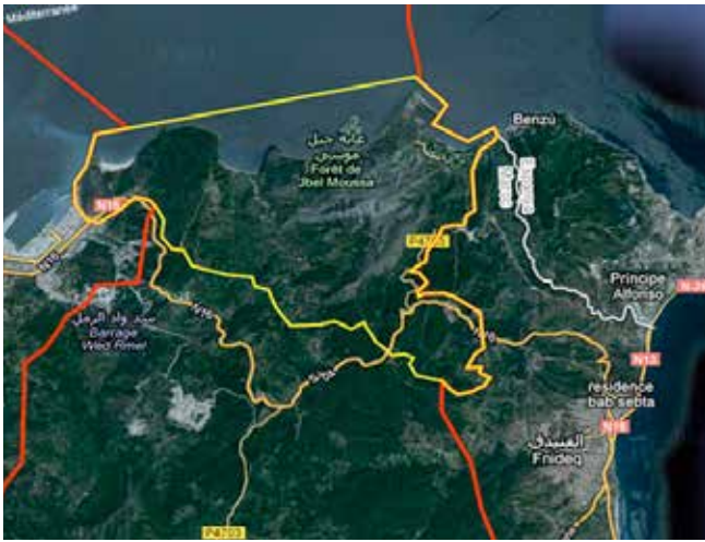
جبل موسى و بليونش من الحدود مع سبتة

القروية بليونش (أنظر الرسم 2)، التي تنتمي ترايبا منذ سنة 2005 إلى إقليم المضيق الفنديق، الذي يعد مكونا حضريا وسياحيا وسكنيا مهما. ويبلغ عدد ساكنة جماعة تاغرامت القروية حوالي 13362 نسمة، وتشمل 23 قرية تتوزع على مساحة 20467 كلم مربع. وتشمل حدود موقع جبل موسى ذو الأهمية البيولوجية والإيكولوجية 10 قرى، تكتسي ثلاث قرى منها فقط أهمية باعتبارها مراكز قروية قائمة بذاتها، وهي: توتية البيوت، بليونش وبنى مزالة. أما الجماعة القروية قصر المجاز، التي تتكون من 12 قرية، فلا تدخل منها في المجال المحدد للموقع ذو الأهمية البيولوجية والإيكولوجية سوى قرية واحدة هي قرية الدالية. وتتميز المنطقة بأكملها التي توجد قيد التحليل بالتنوع على الرغم من صغر امتدادها الجغرافي (حوالي 4000 هكتار)، بفضل مناطقها الساحلية (الشواطئ والمنحدرات)، والداخلية (الجبل)، واعتمادها على محور مفصلي حول الطريق الوطنية رقم 16 التي يمكن الولوج منها إلى شواطئ مهمة مثل الدالية، واد المرسي و بليونش، التي تتوفر على أكبر المؤهلات السياحية.