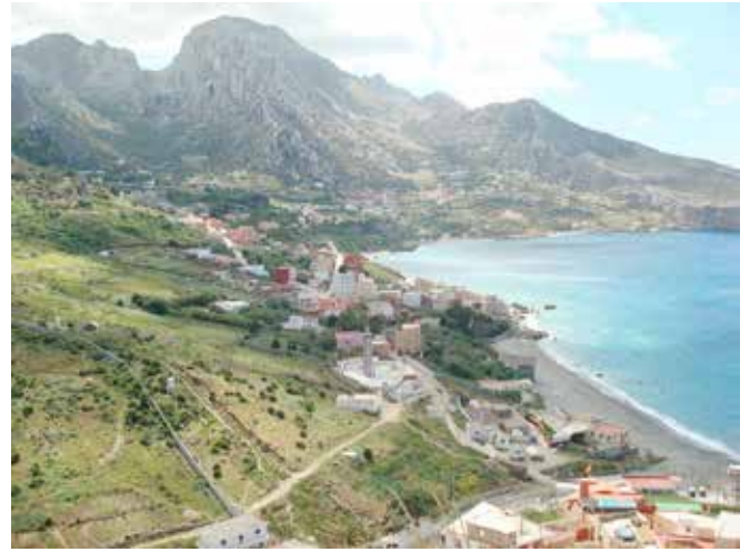
حدود موقع جبل موسى ذو الأهمية البيولوجية والإيكولوجية.

يشكل جبل موسى كتلة صخرية من الحجر الجيري على ارتفاع أقصى يصل إلى 850 مترا، ويتميز بخصوصية طبيعته الشائعة بالمقارنة مع المناظر الطبيعية والجيولوجية للجبال الساحلية الواقع على الجانب الآخر من مضيق جبل طارق في أندلسيا (إسبانيا)، بالإضافة إلى مناظره الطبيعية الأسطورية، والسواحل البرية وإمكاناته الكبيرة لممارسة أنشطة في الهواء الطلق، مثل المشي، والتجول بين الحقول، وركوب الخيل وتسلق الجبال، مشاهدة الطيور أو السياحة العلمية، والتربية البيئية، والغطس ورياضة الصيد، وغيرها، بدلا من جعله وجهة سياحية تقليدية للاستجمام والسباحة على الشاطئ، إذ أن "إستراتيجية السياحة القروية بالمغرب" نفسها تقترح تدخلات في هذا المجال من قبيل إنشاء مركز للسياحة البيئية والتفسير البيئي، وشبكة من المواقع الخاصة لمشاهدة الطيور ومركز لتفسير البيئة البحرية.